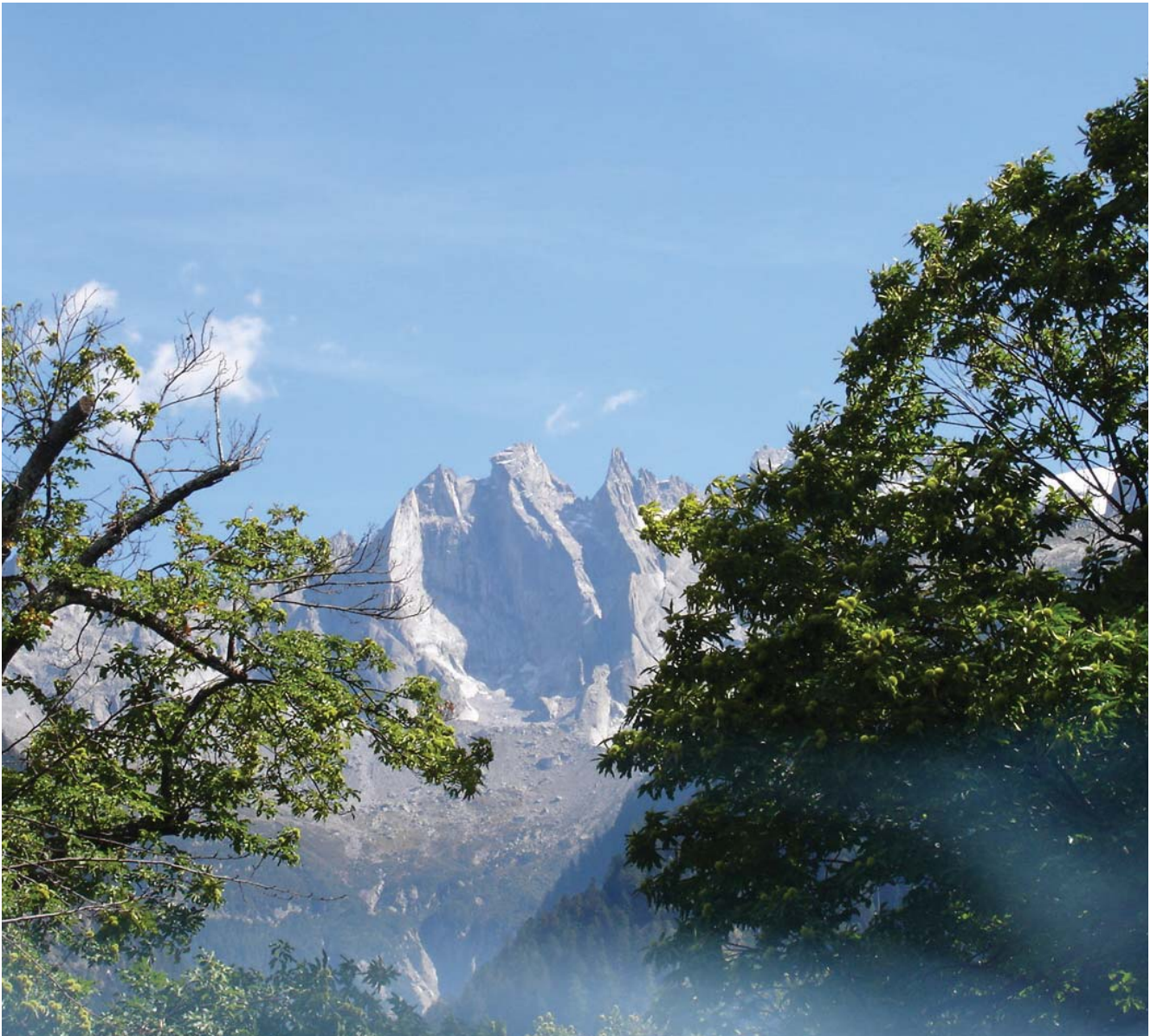
Val Bregaglia

wendigkeit, allfällig Interessierten die Möglichkeit zu bieten, an der PB-Ausbildung teilzunehmen. Es ist eine Projektgruppe entstanden - bestehend vor allem aus verschiedenen in minimovingAlps involvierten Eltern - die für Touristen, aber auch für Einheimische einen Parcours realisieren möchte, der die Idee der Via Bregaglia (geschichtlich-kultureller Pfad durch das Val Bregaglia) aufnimmt und sich insbesondere an Familien richtet. Gemäss der movingAlps-Strategie wird das Projekt von einem PB begleitet, der soeben seine spezifische Ausbildung begonnen hat. Diese Ausbildung absolviert er zum Teil mit den Kollegen aus dem Vallemaggia und zum Teil mit jenen aus dem Val d'Anniviers.