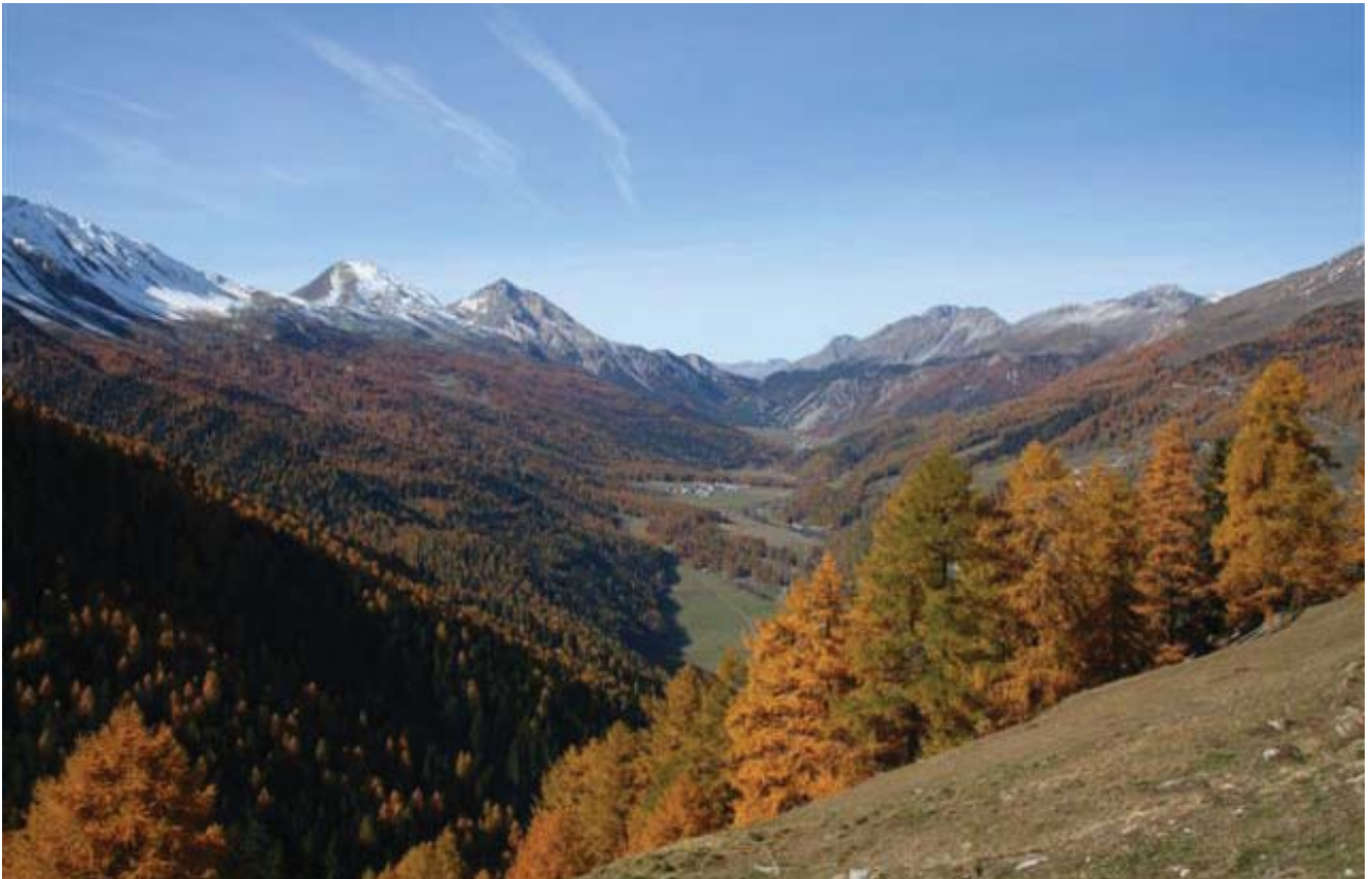
Val Müstair

Teil unvorhersehbar, jedoch in den meisten Fällen identitätsstiftender, kommunikativer und kultureller Natur sind.