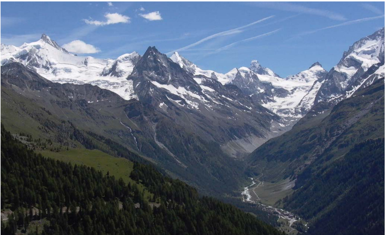
Val d'Anniviers

Projekt Vel Val d'Anniviers: Ein zukünftiges, wohl sehr ambitioniertes Projekt, das durch den Einsatz von Elektromobilen dem Tal ein neues Image geben möchte.